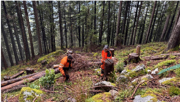
Legende 2: In einer mehrjährigen Förderpartnerschaft mit Wald Uri, dem Verband der Urner Waldeigentümer, finanziert die Dätwyler Stiftung Baumpflanzungen im Urner Wald.