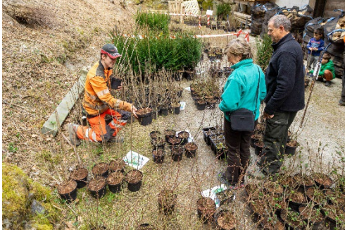
Legende 1: Für das Projekt «Mehr einheimische Vielfalt und weniger Exoten in den Urner Privatgärten» hat die Dätwyler Stiftung im vergangenen Jahr rund 150'000 Franken ausgegeben.