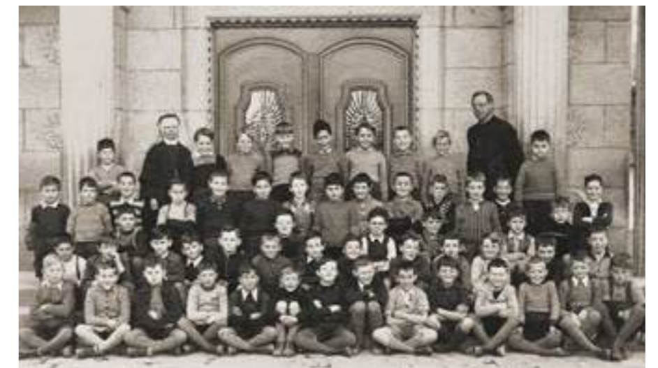
Meine 3. Klasse vor dem Marianisten Schulhaus, 1949. Ich stehe links neben dem Pfarrer.