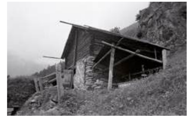
Zwei Weidställe auf Wasserplatten. Es gilt: Das Vieh geht zum Heu – und nicht umgekehrt. Links Heustall jüngeren Typs, rund 60 m oberhalb des Wohnhauses. Der Stall ist quer zum Heuraum angeordnet, das Heu wird über eine Leiter zum Heutor hochgetragen. Rechts: Heustall älteren Typs, rund 60 Höhenmeter unterhalb des Wohnhauses. Stall und Heuraum liegen firstparallel übereinander. Das Heu kann bergseitig relativ leicht durch das Heutor eingebracht werden.

Zimmer zeigt rohe, d.h. nicht verkleidete Böden, Wände und Decke. Einzig ein Teil der Kantholz wand zur Stube verbirgt sich hinter einer Kunststoffolie. In der Nebenstube (Zimmer NW) sind nur die Aussenwände innen mit Täfelung versehen (Brettertäfer mit Deckleiste), Binnenwand-Abschnitte hingegen nicht verkleidet. Boden und Decke bestehen aus breiten Brettern, die quer (Boden) beziehungsweise längs zur Firstrichtung (Decke) verlegt sind. Die beiden Kammern im ersten Obergeschoss erreicht man über eine Holzterrasse in der Küche, die entlang der Stubenwand auf einen Laubengang führt. Die Räume selber können von dieser Plattform aus je einzeln betreten werden. Auch diese Türöffnungen verfügen über seitliche Mantelstüde als Pfosten, und die Räume sind russgeschwärzt, ohne Wandverkleidungen. Boden und Decken bestehen aus rohen Bohlen, die, wie erwähnt, identisch sind mit den Deckenbrettern der darunterliegenden Räume.