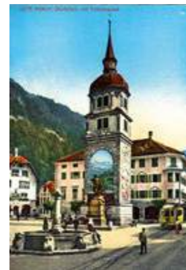
Altdorf, Rathausplatz, 1946

Mit siebzehn zog ich nach Zürich, um an der Kunstgewerbeschule eine Ausbildung zum wissenschaftlichen Zeichner und Illustrator zu beginnen. Als ich im Rahmen der Ausstellung «Der Film» (1960) den Stummfilm «Nanook of the North» (1922) von Robert J. Flaherty über eine Inuit-Nomadenfamilie in der Arktis sah, entschied ich mich noch im Kino Filmmemacher zu werden. Da es damals in der Schweiz keine Filmschule gab, wechselte ich an die Fachklasse für Fotografie derselben Schule und begann, meine ersten Kurzfilme zu drehen. Seither lebe und arbeite ich als Filmmemacher in Zürich.