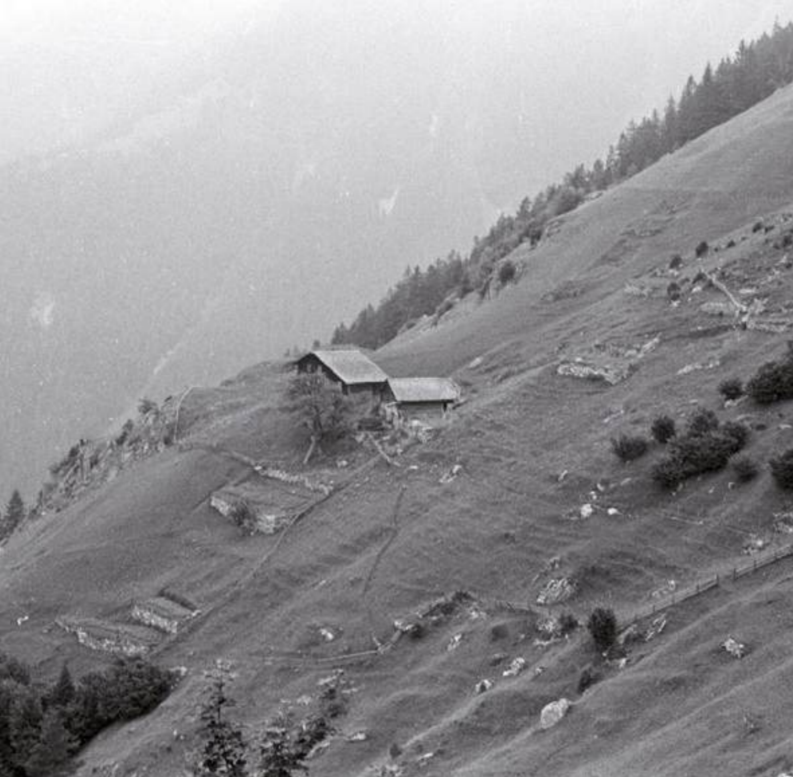
Silene, Wasserplatten 1'118 m ü.M. Sicht von Süden auf Wohnhaus und Heustall. Trockenmauern mit Hinterfüllungen bilden kleine Terrassen.