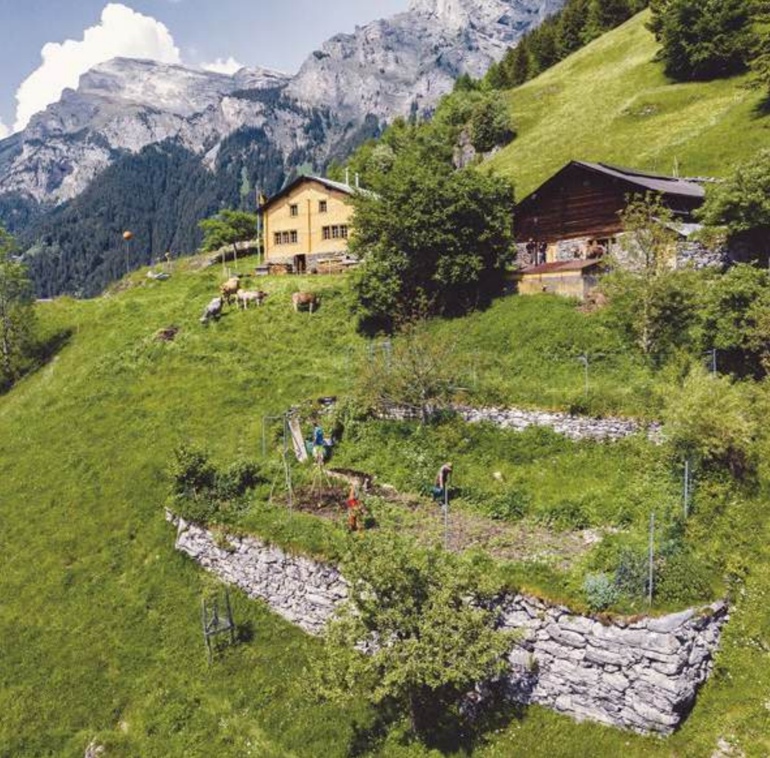
Wasserplatten, 2023.