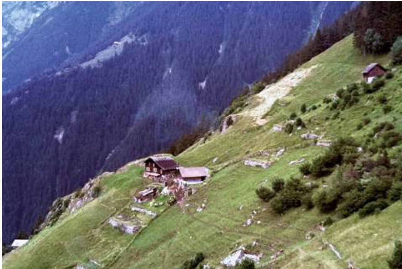
Mein erstes Foto vom Heimet Wasserplatten.