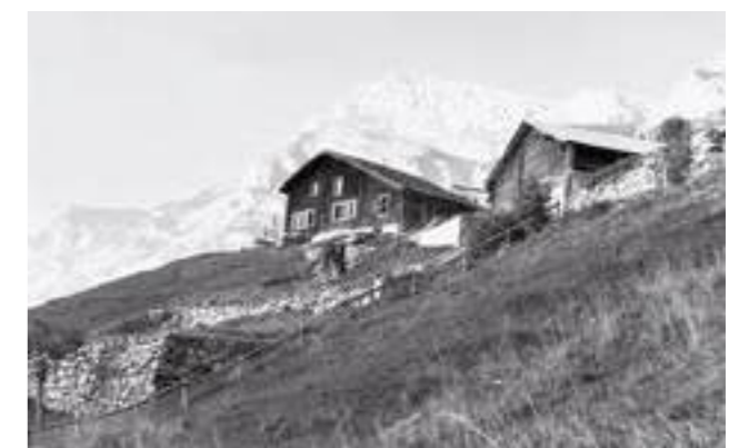
Das Wohnhaus 1979. Verschindelter Blockbau, wohl in der Mitte des 17. Jahrhunderts als Doppelwohnhaus errichtet mit zwei Stuben und Kammern im Vorderhaus. An der südlichen Traufe ein später angebautes Zimmer. Das Dach ist mit Schindeln eingedeckt. Rundhölzer, vom Hang her an die bergseitige Dachkante gelehnt, schützen das Haus gegen die erheblichen Druckkräfte von Kriechschnee.