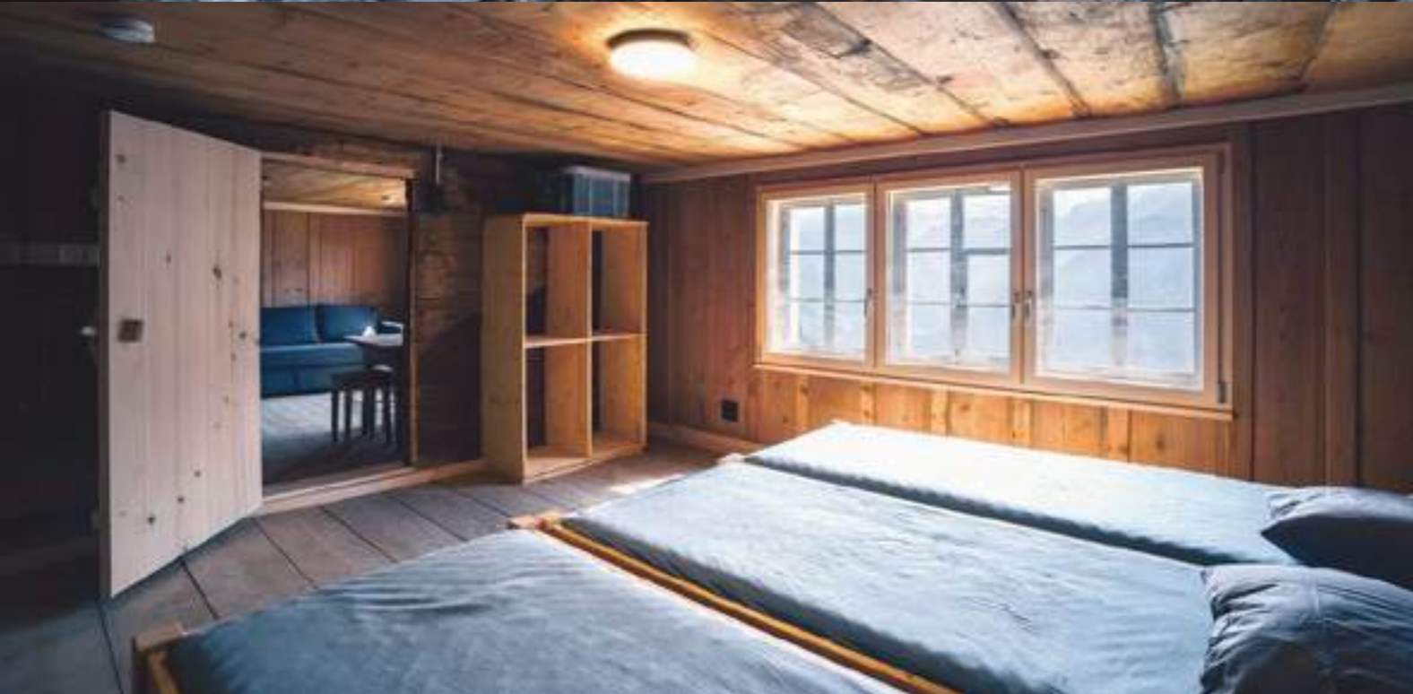
Sanierung Wasserplatten, 2023.