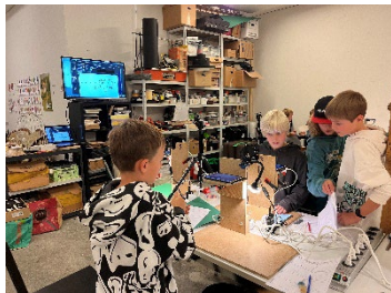
FerienspassUri 2024 Trickfilm.jpeg

Der Urner Ferien(s)pass ermöglicht Kindern und Jugendlichen vielfältige und kreative Ferienerlebnisse.