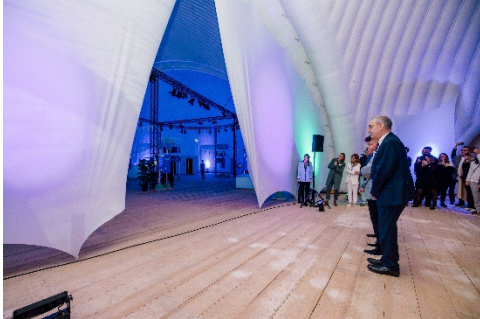
Feierliche Eröffnung der Phänomena in Dietikon: Bundespräsident Guy Parmelin eröffnet die Ausstellung im Beisein zahlreicher Gäste.