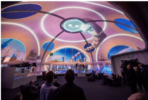
Wenn lernen begeistert: Die «Phänomena» lädt Schülerinnen und Schüler zum aktiven Entdecken und Mitdenken ein.